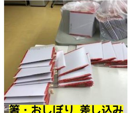
箸・おしぼり 差し込み